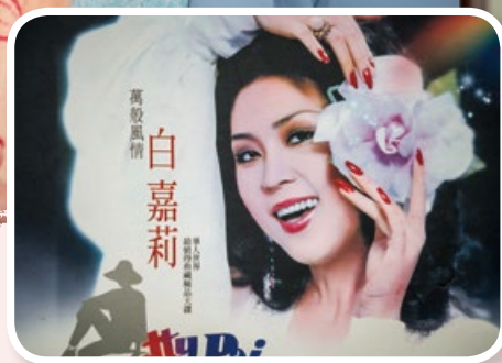
▲白嘉莉也出過好幾張專輯。

白嘉莉是台灣電視圈的傳奇人物，高貴典雅的氣質，風姿綽約的儀態和穩建台風，豎立了早期節目主持人的典範，很多人想要模仿，卻始終無法超越。在她身上也有一些有趣的傳說，特別是為何一出道，就有如此大將之風？！